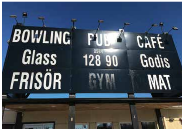
Laxå glassbar öppnar den 1 maj med glass från Klings glass i Mariestad.

Glassälskare får sitt lystmäte när Laxå bowling dessutom öppnar Laxå glassbar i ett samarbete med Klings glass i Mariestad.