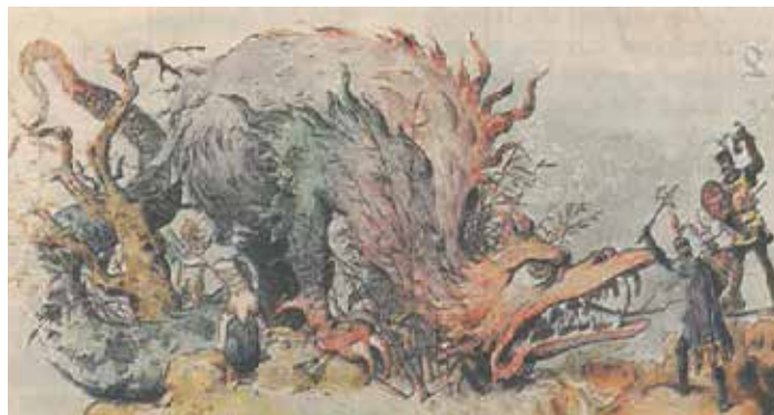
En av skisserna till karnevalståget 1904. Draken symbolisar "D" i alfabetparaden.

Denne karnevalsgeneral var oupphörligt en produktiv konstnär och målade parallellt med sitt uppdrag, genomförde resor i Louisiana, till Kuba och Mexiko där han letade motiv. Han engagerade sig även i det konstnärliga livet i New Orleans och bildade Artists association of New Orleans, i vars