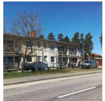
Gamla vandrarhemmet på Linnéagatan 2 förvandlas till sex lägenheter med nyproduktionsstandard.

Är du intresserad? Hör av dig till Laxåhem, 0584-47 35 00, eller gå in på hemsidan www.laxahem.se och anmäl dig!