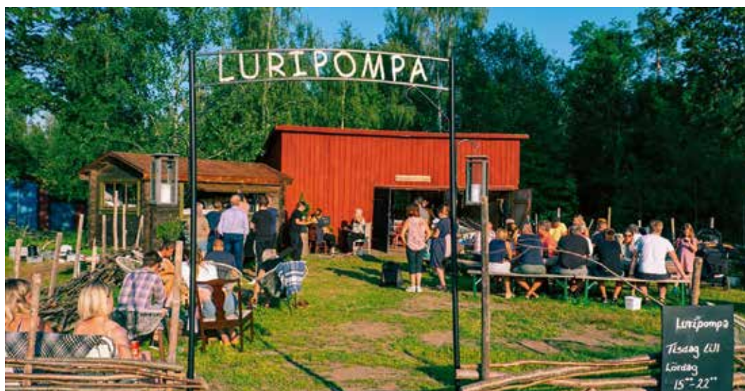
Luripompa i Sannerud blir en scen för Tiveden Americana, förhoppningsvis i sommar, annars 2021!

Pengar var först stötestenen, det kostar att kontrakta band från över there. Men Leader Mellansjölandet bidrog med 600 000 kronor och Region Örebro plussade på med 75 000 kronor, för att man i samband med festivalen skulle kunna arrangera en låtskrivarworkshop. Kommunen skrev avtal med Robbie Dunnes studio i Alfta, som är beredd att ställa den till låtskrivarnas förfogande några dagar före festivalhelgen som planerades, och fortfarande i skrivande stund