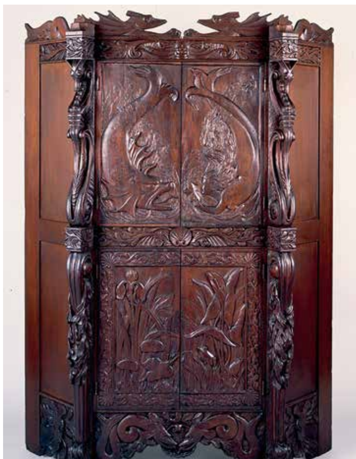
Mermaid cabinet, ett magnifikt mahognyskåp, dekorerat med Anders Wikströms bilder 1900–1905. Skåpet finns på det Moderna museet i New Orleans, NOMA.