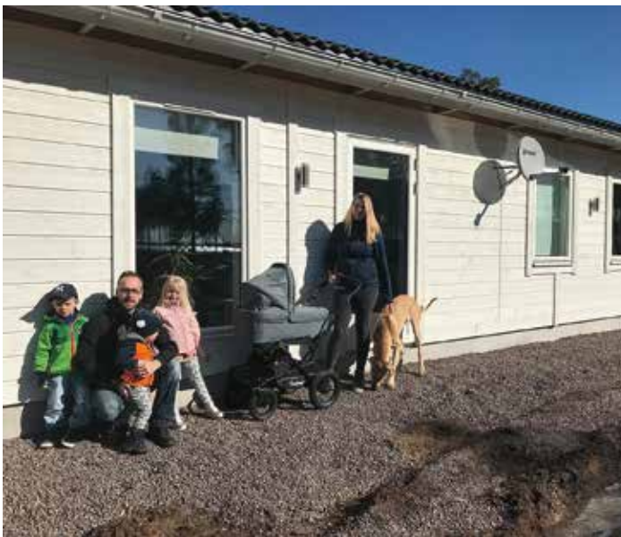
Här ska det bli altan med bästa läge mot sjön.