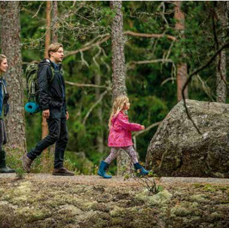
härlig vandringstur i skogen med familjen eller softa med kompisar i arna till tals!

re är om de som bor i kommunen kan vara med från början till slutet: att sätta ord på problemet och tillsammans skapa en åtgärdsplan och följa processen tills de formella besluten har tagits. En sådan medskapande process möjliggör egenmakt, känslan att man har makt över sin egen situation.