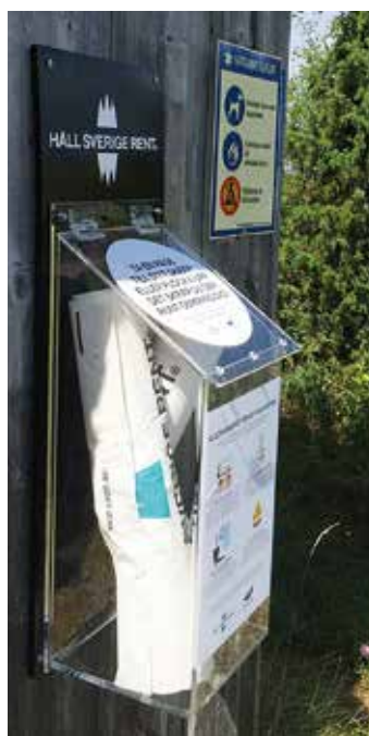
Plastpåsholkar efter leder minskar nedskräpning.