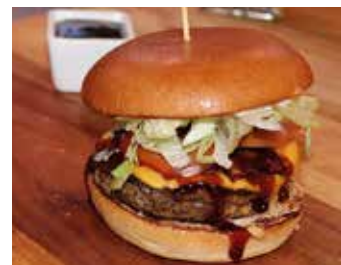
Enkel och god mat vill Jinnestrands bjuda på.