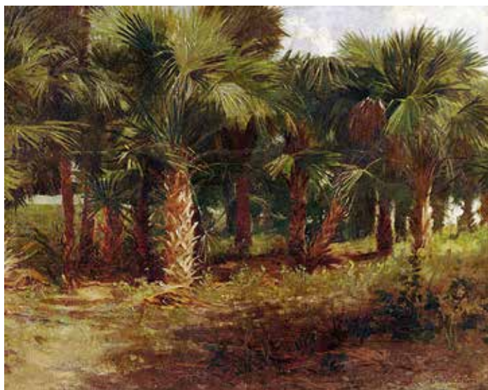
"Palmettos in City Park", New Orleans, 1900.