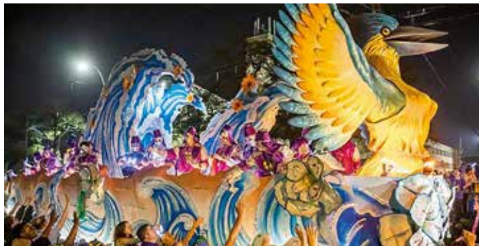
Inslag från årets karneval i New Orleans 2020.

konstskola han var teckningslärare under tolv år.