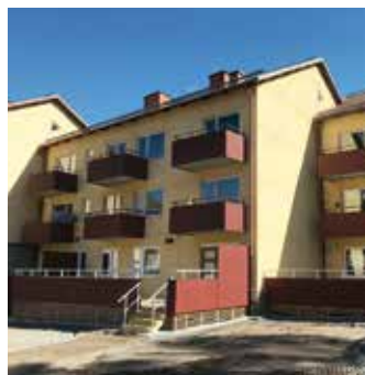
Här på von Boijgatan 12 är fyra nya lägenheter inflyttningsklara i maj.

Tvåorna är 57, respektive 81 kvadratmeter stora och kostar 6 275, respektive 8 878 kronor i månaden.