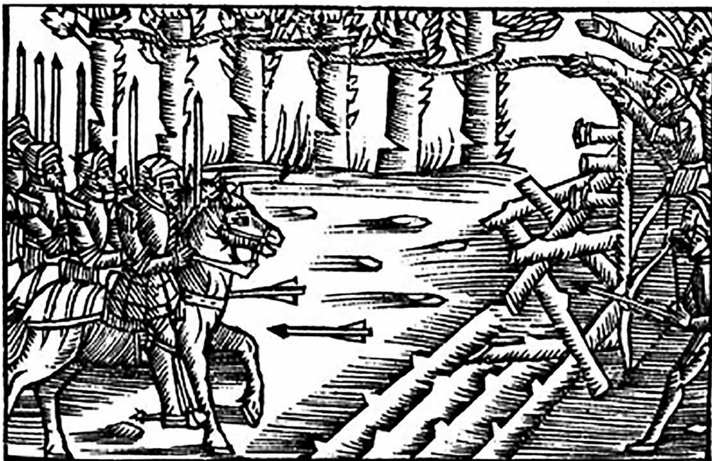
Så kunde bråtarna förberedas. Bilden är från Olaus Magnus – Historien om de nordiska folken och som visar på bönder i strid med riddare vid väl förberedd förhugning.

som Nikolaikyrkan i Örebro. Murbygget måste ha skett någon gång åren före 1520 eftersom Gustav Wasa upplöste Antoniterorden 1530 efter reformationen 1527.