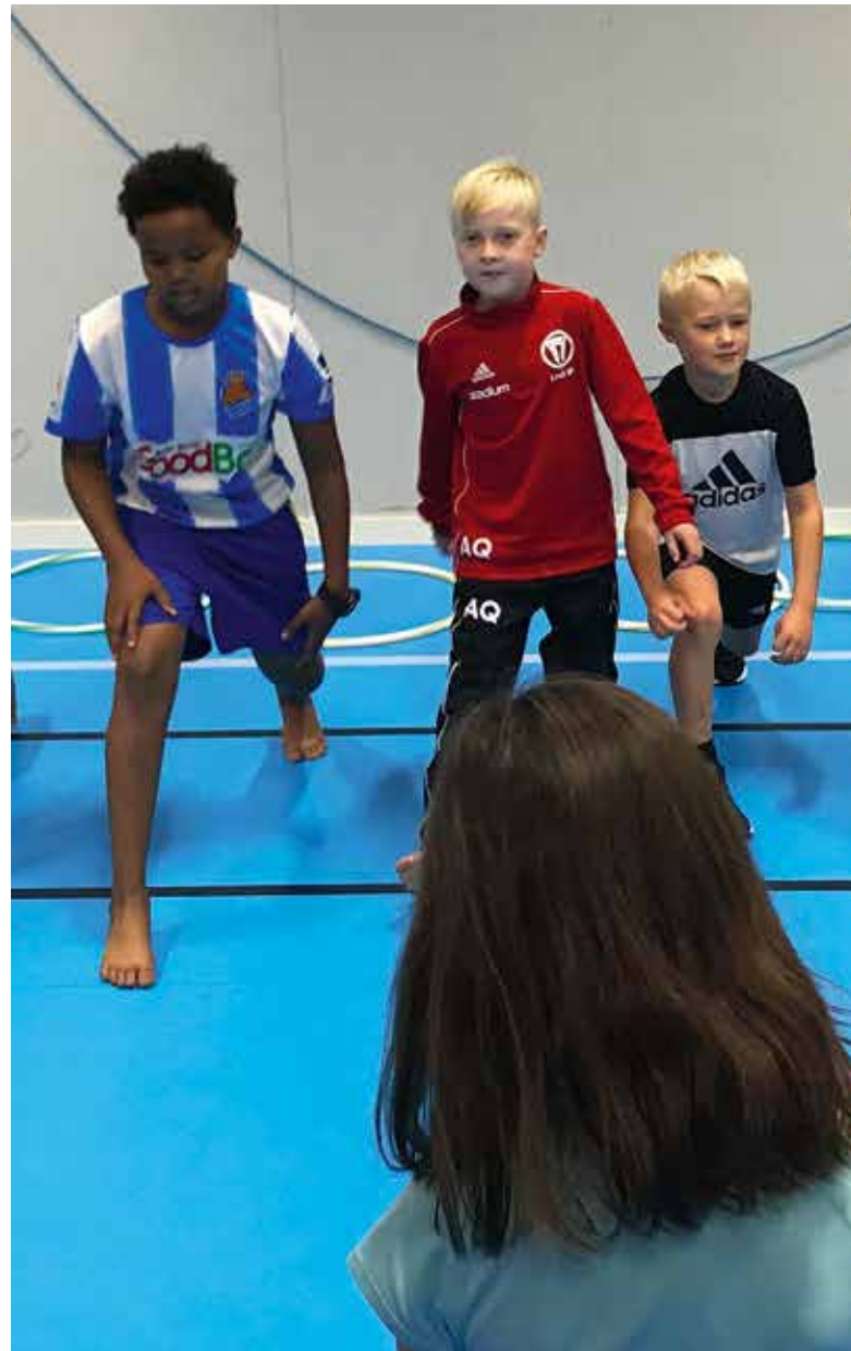
Barnen i klass 3A på Saltängsskolan kommer loss i uppvärmningen inför