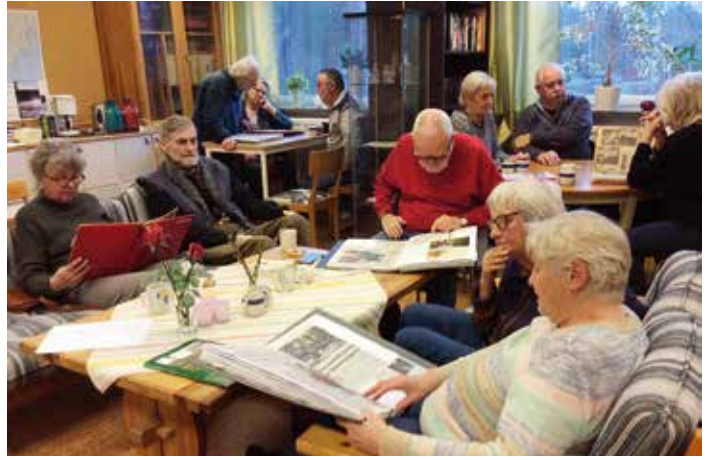
Tiveds utvecklingsgrupp träffas och trivs för sin ortspeng.