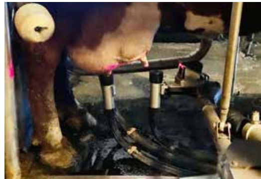
Kossan Majros mjölkas efter en föregående avtvättning av spenar och juver. Under tiden detta sker får hon extra tilldelning av kraftfoder.