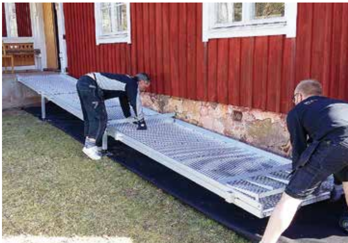
Ortspengen till Tiveds hembygdsförening räckte bland annat till handikapp-ramp till det gamla skolhuset i Dammtorp. Det var Kvistberga Group i Ramnäs som levererade och monterade rampen.