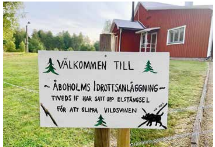
Idrottsanläggningen Åboholm i Tived fick del av ortspengen för att bland annat laga skadad gräsmatta och sätta upp stängsel mot vildsvinen.