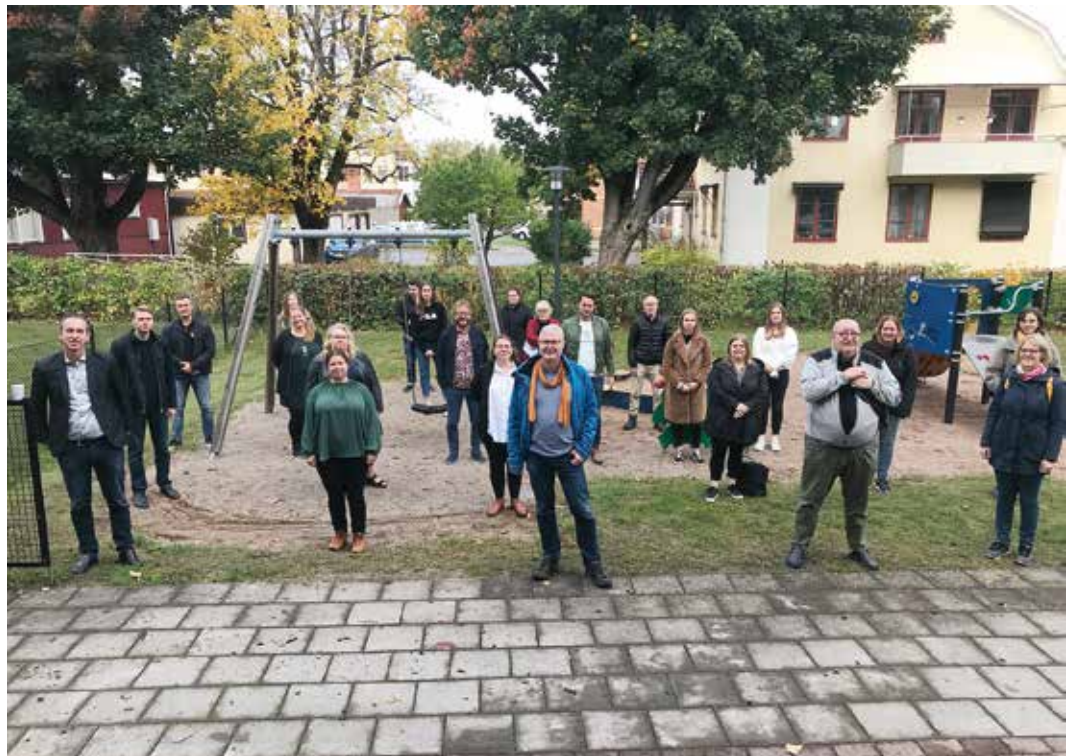
Den 8 oktober träffades de anställda i Sydnärkes Miljöförvaltning och Sydnärkes Byggförvaltning i det första stormötet inför sammanslagningen. Mötet hölls i Kunskapens hus i Laxå.

Delegationsordning, mötestruktur, telefoni, personalsys-