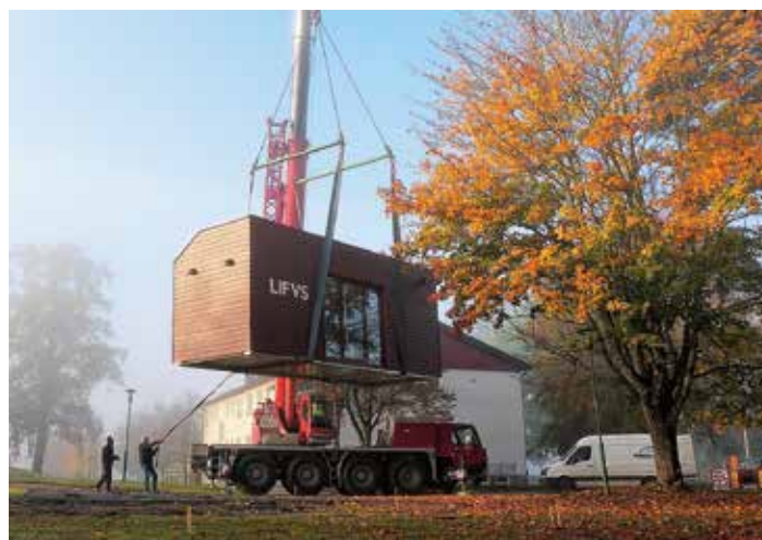
Lifvsbutiken på plats i Hasselfors, öppnar i november.

Lifvsbutiker finns redan i omkringliggande orter som Östansjö, Svartå och Degerfors och är den första i Laxå kommun.