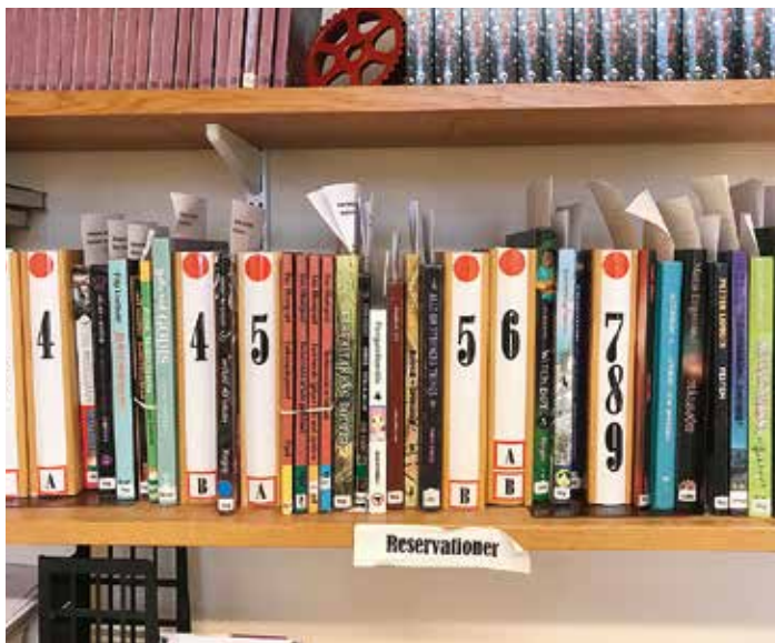
Läsintresset ökar bland eleverna, vilket ger köbildning för att få läsa böcker.