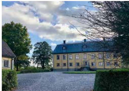
Bålby säteri från 1765 är i dag ett helt igenom ekologisk lantbruk.