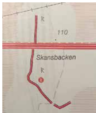
Fick danskarna på pälsen av Sten Stures bondearmé vid Skansbacken? En utgrävning av fornlämningen kanske skulle kunna bringa klarhet. Kartbild över Skansbacken

med områdeshistoria som ska hängas i Sockenstugan. De kompletteras med en monter med fynd som gjorts på plat-