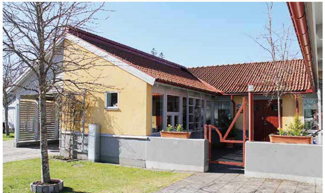
Fem radhus byggs i centrala Laxå.

Det var under sommaren som det kommunala bostadsbolaget infortrade intresseanmälningar inför nybyggnation av ett antal lägenheter i