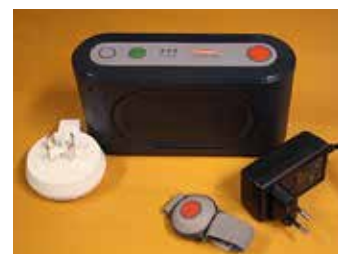
Alla kommuninvånare över 75 år erbjuds ett larm som ansluts endera till vanliga vägtelefonen eller till GSM-nätet som trådlöst.

nom nattens händelser, vilka brukare som larmat och vilka besök som larmet föranlett, hemtjänst eller sjuksköterskebesök.