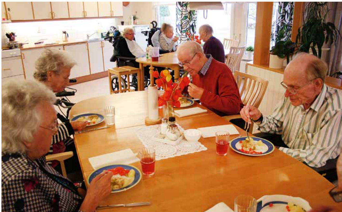
De äldre i Laxå kommun ger personalen högsta betyg.

är att organisera arbetet så att undersköterskornas kompetens bättre tas tillvara.