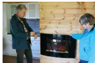
Inte heller en värmande brasa saknas i de nätta stugorna med full utrustning och fiberanslutning.