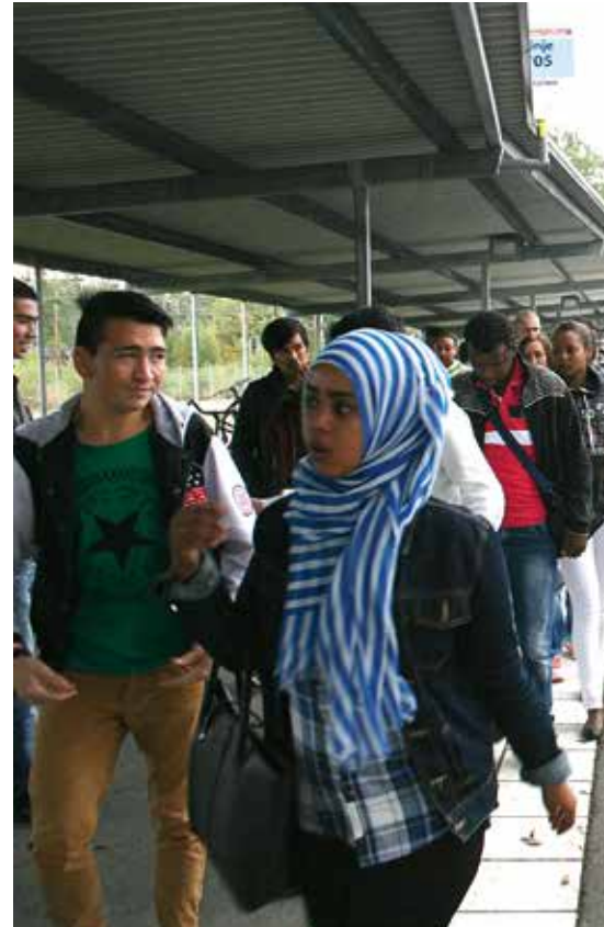
761:an anländer Laxå station med några minuter kvar skolan.