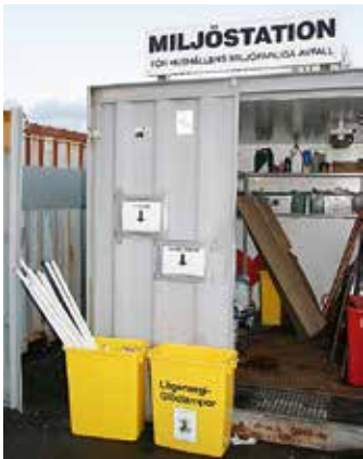
Plats för sorterade sopor.