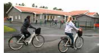
Lindåsens nya förskola.