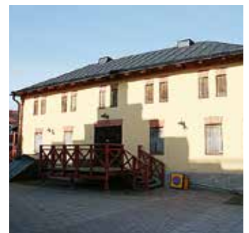
Gula magasinet på Casselgatan 6.

En annan fastighet som också lätt kan återtas som bostäder är vandrarhemmet på Linnégatan 2. Där finns potential för 10–12 lägenheter.