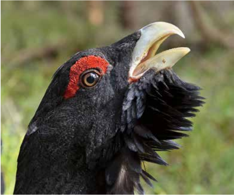
Knäppningar klunk och sisningar. Tjädertuppen spelar extatiskt för hönorna, andra konkurrenter och andäktig publik i flera timmar.