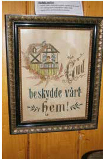
Kvinnorna broderade tavlor.

Gud beskydde vårt hem! En tavla broderad på stramalj berättar om resandefolkets vedermödor på en utställning i Finnerödja hembygdsmuseum i sommar.