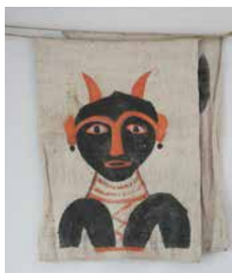
Vackra vargskynken skrämdе djuren från bebodda trakter.