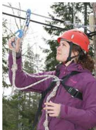
Okej, på med hakarna! Tänk på att en hake alltid måste vara kvar på repet!

och parera stockens svängningar under fotstegen.