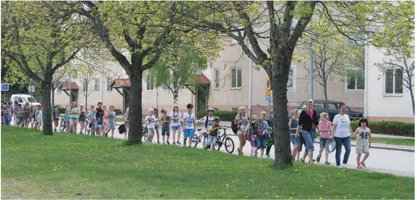
Barnen kom i långa rader när Fritidshemmens dag arrangerades i Bodarneparken. Till fots från Lindåsen och Saltängen och i buss från Finnerödja.