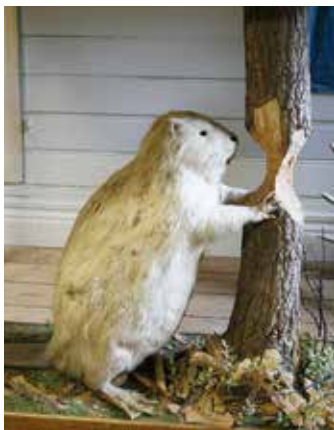
Den vita bävern i aktion.