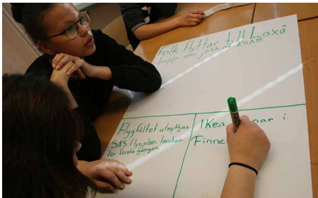
Ett riktigt dragnummer på grupp 1:s tidningslöpsedel om Ikea som öppnar i Finnerödja och bjuder på gratis "körv".