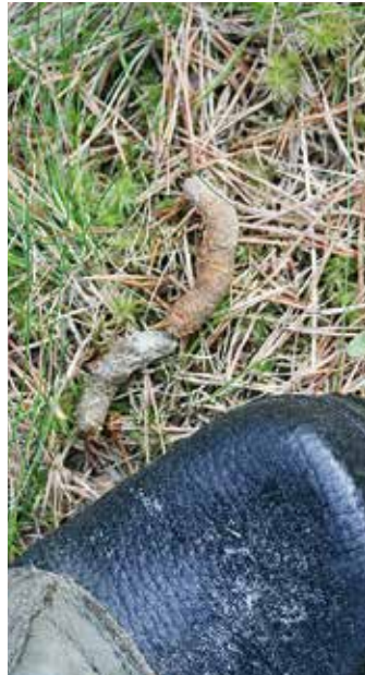
Tjäderbajset avslöjar i vilka tallar tupparna sitter på kvällen och natten. Då bajsar de var tionde minut.