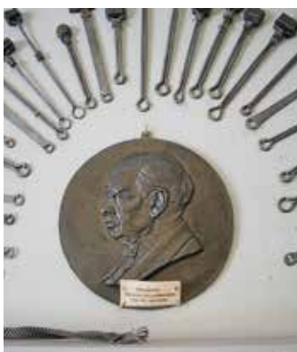
Carl Sahlin, bruksdisponent 1900–1917, startade Bruksmuseet.