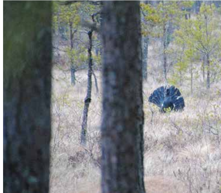
Tjädertuppen intar scenen i den 120-åriga naturskogen. Tålmod och tid skådespelet när tjädern sätter i gång sitt spel.