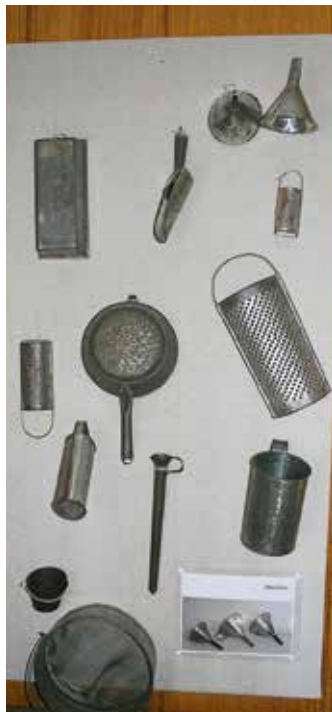
Innan industrin tog över massproduktionen av hushållsredskap tillverkades de för hand av resandefolket.

Öppettider i sommar: fredag-söndag kl 13-17 veckorna 26-31.