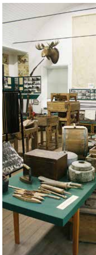
Stora salen i Hasselfors museum.