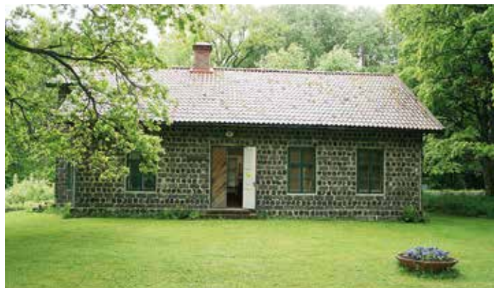
Hasselfors vackra bruksmuseum byggt i grön slaggsten erbjuder många roliga inslag.