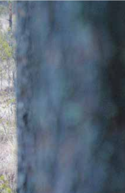
krävs av den människa som vill uppleva