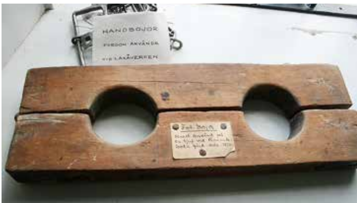
Forna tiders bestraffningsmedel.