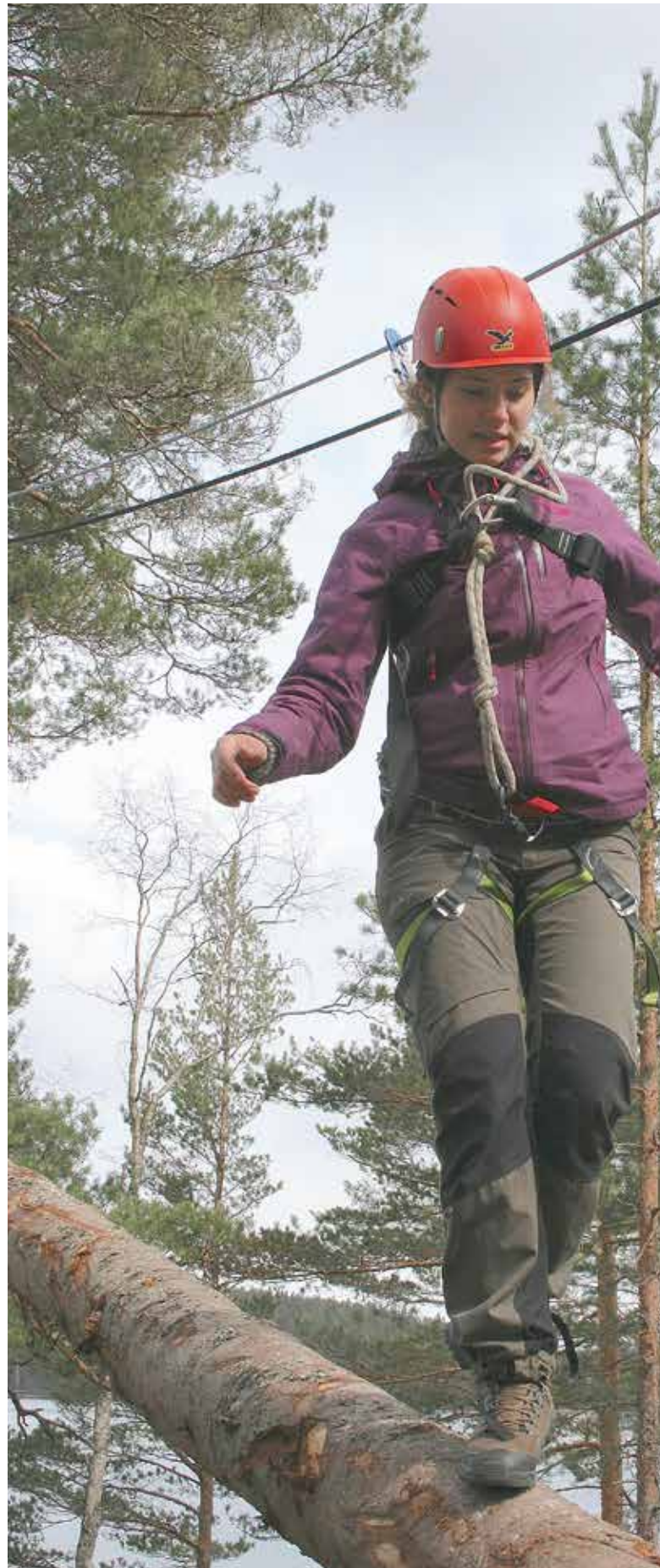
Vågar väl släppa händerna!!

Wall of Fame är en utställning som Örebro läns idrottshistoriska sällskap tagit fram över länets mest kända idrottare i modern tid. Laxå var först ut i utställningens turné som nu fortsätter i en rad andra kommuner i länet.