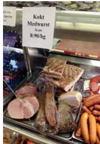
Den manuella köttdisken rationaliseras inte bort i Tiveds handel.

Den nye handlaren vill satsa på den lantliga touchen och har gett butiken en mer klassiskt stil. Han har bytt den moderna kassadisen mot en gammal variant och har plockat fram lite rariteter i varuutbudet från förr, bland annat en glasdisk med filmstjärnor och gamla bilar och exponeringslåda för