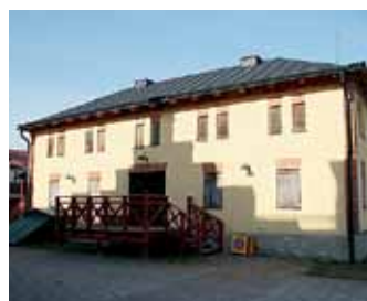
Laxåhems magasin blir bostäder.

Eftersom efterfrågan på bostäder i Laxå ökar tas nu utnyttjade utrymmen, på vindar