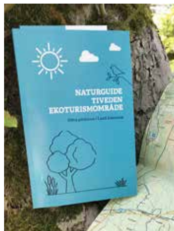
Något att hålla i handen på strövtåg i natursköna trakter.