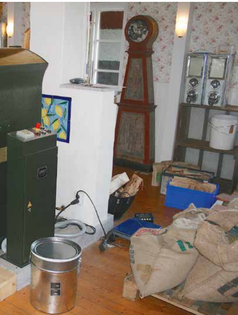
i flytten från Tyskland.