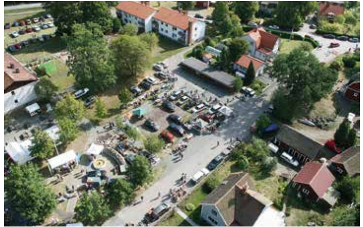
Kalasorten från 60 meters höjd.