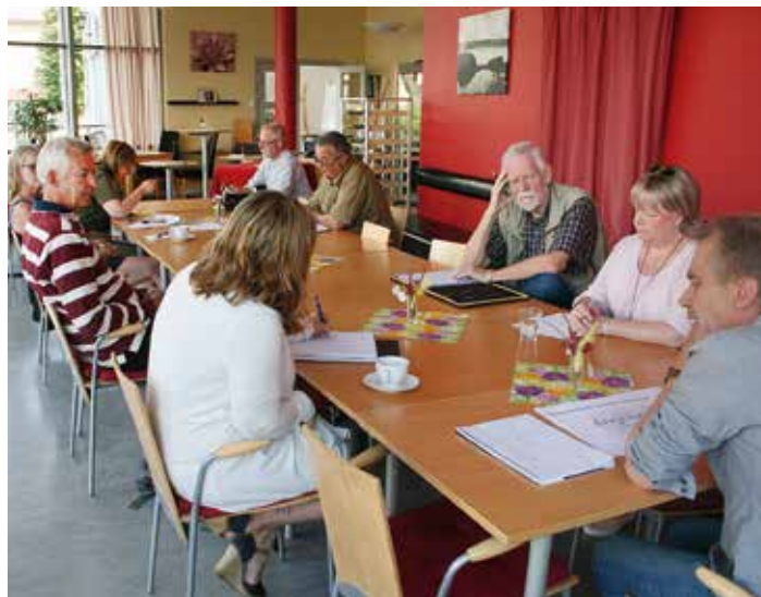
Representanter från kommunens olika byalag och utvecklingsgrupper träffas regelbundet för utbyte av information, samråd och idéarbete.

Mötet före sommaren innehöll bland annat information om Hasselforskalaset, Tiveds utvecklingsplan, invigningen av Finnerödja skola och biblioteksatsningen.