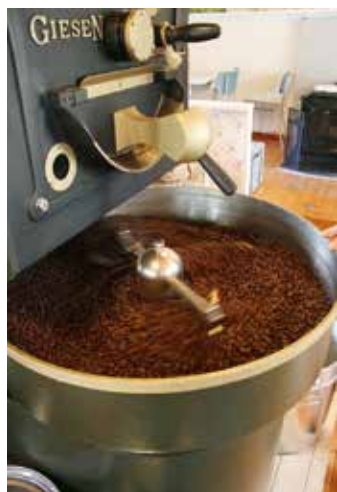
I tio-femton minuter ska bönorna rostas, beroende på bönsort och väder och vad de ska användas till.

odlingar för att kunna erbjuda kunderna närodlat och ekologiska grönsaker och kryddor på smörgåsen.