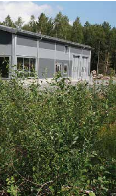
bilhall växa fram.