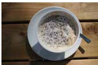
Varsågod, en kopp Tived Special med bönor från Papua Nya Guinea, Indian Robusta och en colombiansk sort.