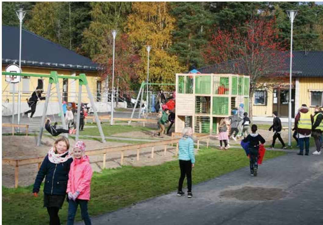
Saltängens skola har åtgärdats i flera steg, slöjdsalar, matsal, toaletter och gymnastiksal har renoverats och under sommarlovet fick eleverna en ny skolgård med lekredskap och belysning.