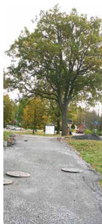
Pågår: Anläggning av gång- och cykelbana till vårdcentralen i Laxå.