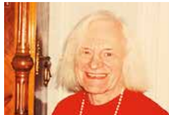
Charlotte von Mahlsdorf var mycket omtyckt i Porla med omnejd under sin tid på orten. Nu visas pjäsen om hennes liv.

– Hon bjöd in mig till museet om sitt eget liv och jag förstod direkt att det skulle kunna bli en bra dramatik kring henne. I tre år reste jag till Berlin för att intervjuer och när hon flyttat till Porla brevväxlade vi. Jag förstod då att hennes historia var mer komplicerad än jag trott. Med ett underlag på 500 sidor började jag misströsta att jag någonsin skulle få till en pjäs om henne.