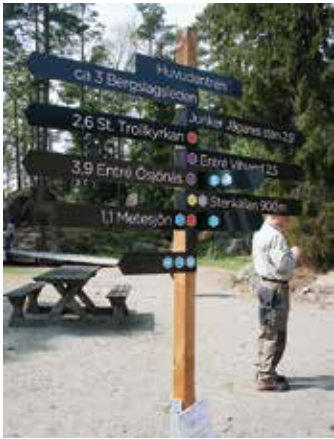
Marknadsföringsinsatser gav fler besökare i Tiveden.