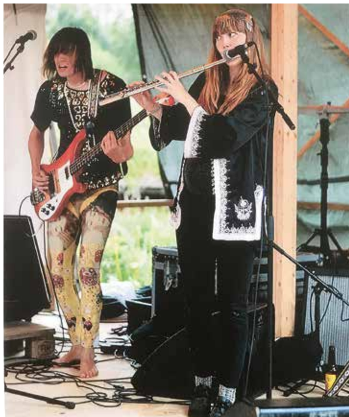
Musikgruppen Me and my Kites spelar på Tivedstorpsfestivalen.

– Kulturen är viktig! Den berikar oss som individer och i vårt samspel med andra. Den gynnar kommunens tillväxt och attraktivitet och stärker vår kommuns demokratiska utveckling.