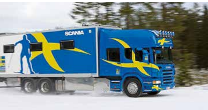
Bilden överst: Laxå Special Vehicles bygger ut och finns nu på fyra olika platser i Laxå. Bilden under: Svenska skidlandslagets vallbil har specialutrustats av Laxå Special Vehicles i Laxå.