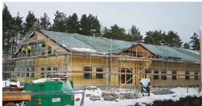
Skolan byggs ut med 1 500 kvadratmeter.