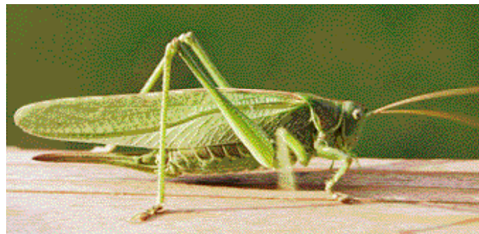
En verklig förlaga till Hasselfors nya utsmyckning.