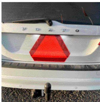
LGF-skylden avslöjar att den blänkande Volvon är en a-traktor.

Till Hallsberg åker han dock tåg. Skulle han ta a-traktorn tar den skolresan en timme och 10 minuter hemifrån Nyhammaren.