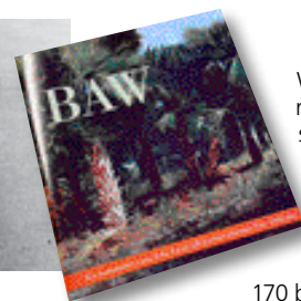
Boken om BAW, Bror Anders Wikström, får sin release på vernis-sagen för utställningen den 25 augusti. Den omfattar 160 sidor och illustreras med 170 bilder, merparten ur konstnärens produktion.

– Jag har också fått många nya kontakter i USA som har lärt mig mycket och som har