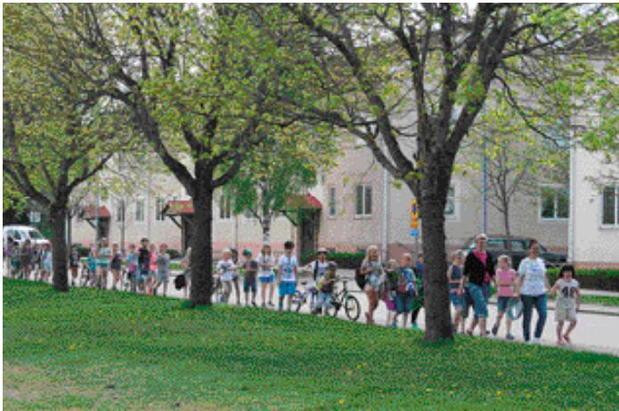
Fritidshemmens dag i Bodarneparken.