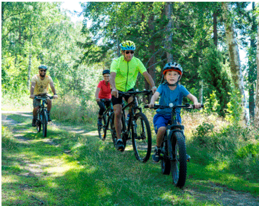
I sommar erbjuds besökarna i Tiveden 10 mil uppskyldade cykelleder att upptäcka Nationalparken ifrån.

” Särskilt roligt är att vi röjt upp en ny led tillsammans med länsstyrelsen i nationalparken där det annars är förbjudet att cykla. Den är en fin och barnvänlig slinga.