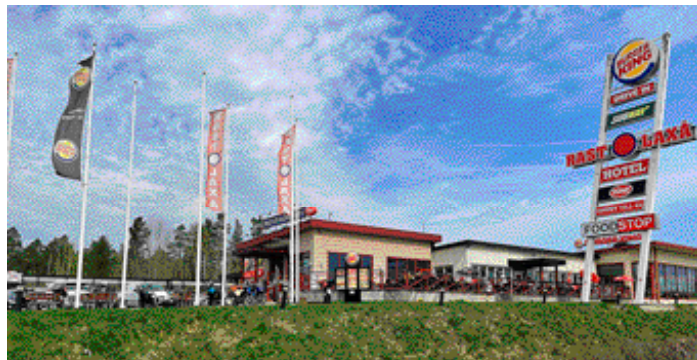
Laxå kommuns läge efter E20 är en fördel.

”Jag alltid känt mig likvärdig med svenskar trots att jag