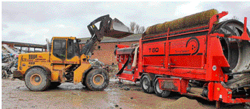
Laxå kommun har avtal med Hallsbergföretaget Adrianssons Schakt & Transport AB som transporterar bort och hanterar avfallet.

En beräkning görs att det kommer att kosta cirka 6,5 mil-