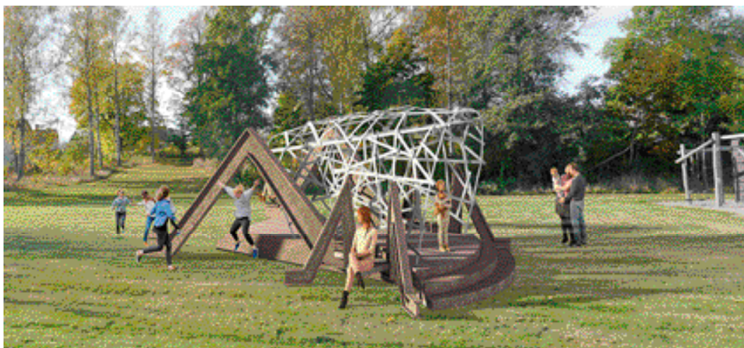
Konstverket blir mötesplatsen för alla åldrar i Hasselfors. Bilden är ett montage.

Konstnärerna vill nu söka samarbeta med Hasselforsborna kring hur området runt Hasselhoppa ska se ut. Det kan gärna ske på en Hasselhoppans Dag där barn och vuxna umgås med tävlingar och lekar i parken och som kan bli årligen återkommande.