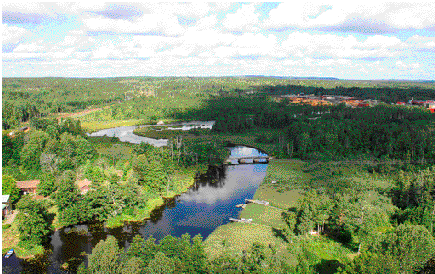
Svartån förbinder sjöarna Toften och Teen.