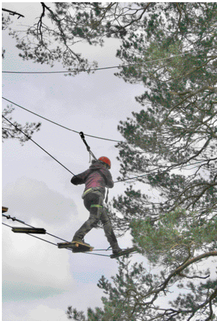
Höghöjdsbanan i Ösjönäs.

Oavsett var i kommunen man bor så framkommer det i nästan alla samtal att närheten till naturen är den allra viktigaste faktorn för trivsel och välmående. I samtal med boende i och omkring Hasselfors, Røfors, Finnerödja och Tived framkommer det att många värdesätter livet i den