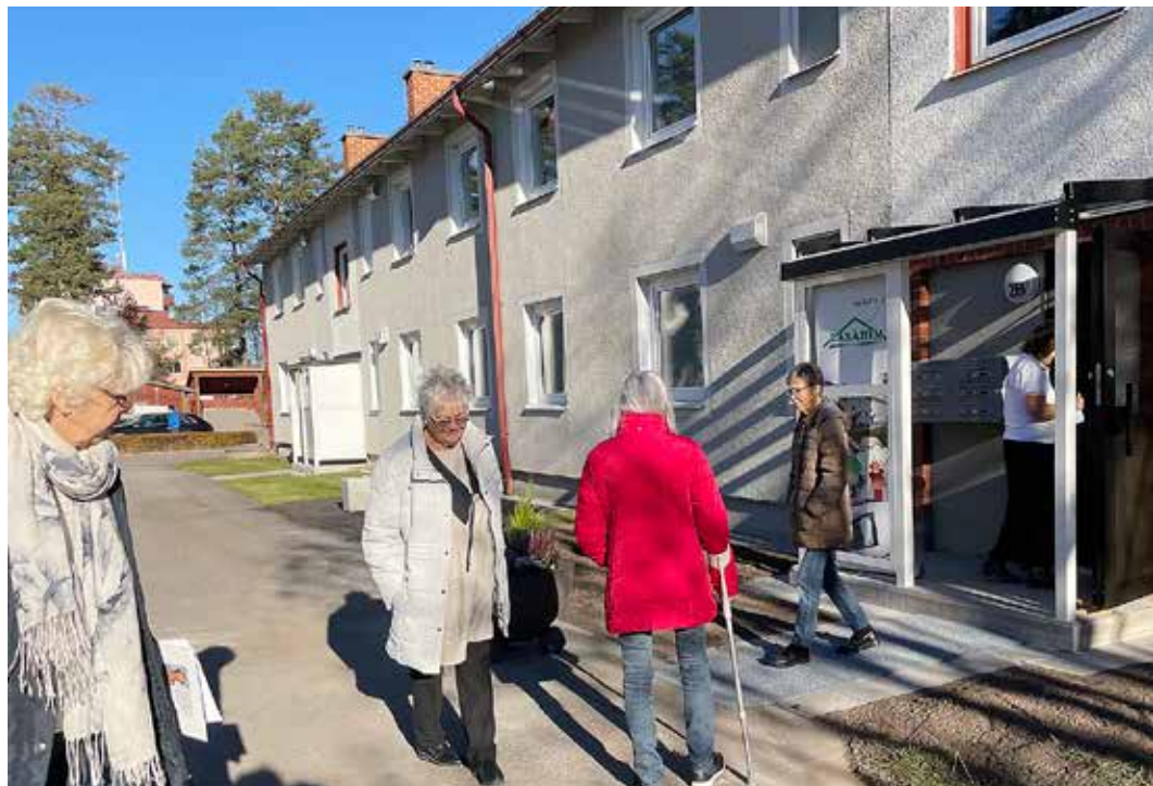
En strid ström av besökare en lördag i slutet av oktober när Laxåhem visade de nyrenoverade lägenheterna på Linnéagatan 2 i Laxå.

Hon har tumstocken i handen och tänker ut hur hon ska möblera. Ett vitt skåp, en skänk, två stolar, och en soffgrupp får plats i vardagsrummet, medan hon nog får fun-