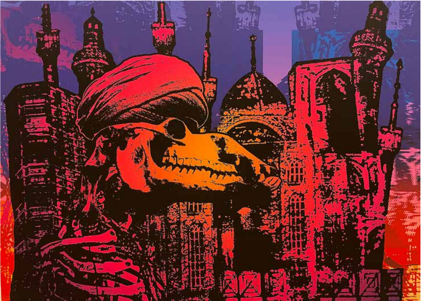
En konstnärlig kommentar till de styrande mullorna i Iran.