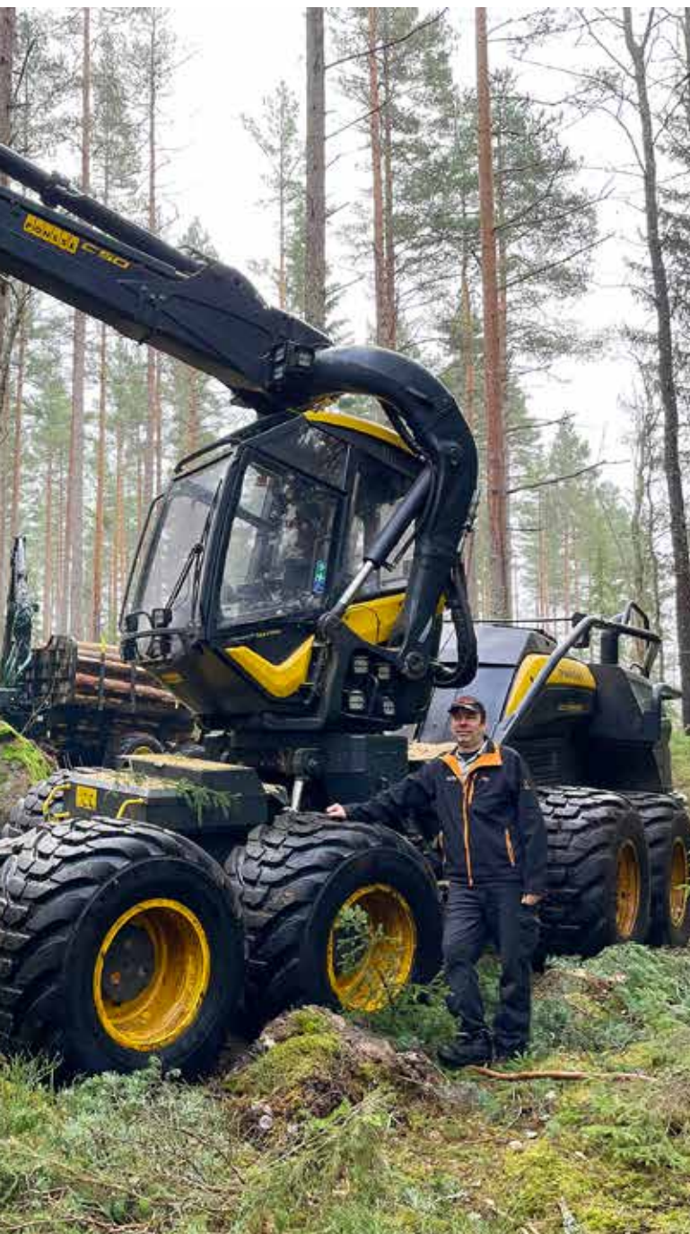
plocka träden i skogen.