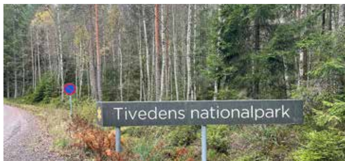
Skogen runt Tivedens nationalpark ska vara inbjudande att gå i. Därav hyggesfritt skogsbruk.