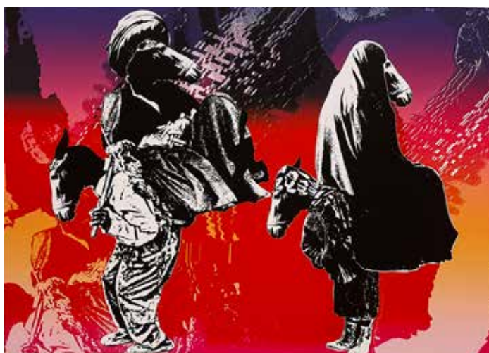
Verk som symboliserar den religiösa minoritetens totalitära makt.