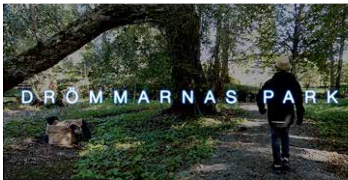
Drömmarnas park tog hem distriktsfinalen i Noomaraton, tävling för filmskapare.

huset för att berätta hur de kan hjälpa till att utveckla filmmakandet.