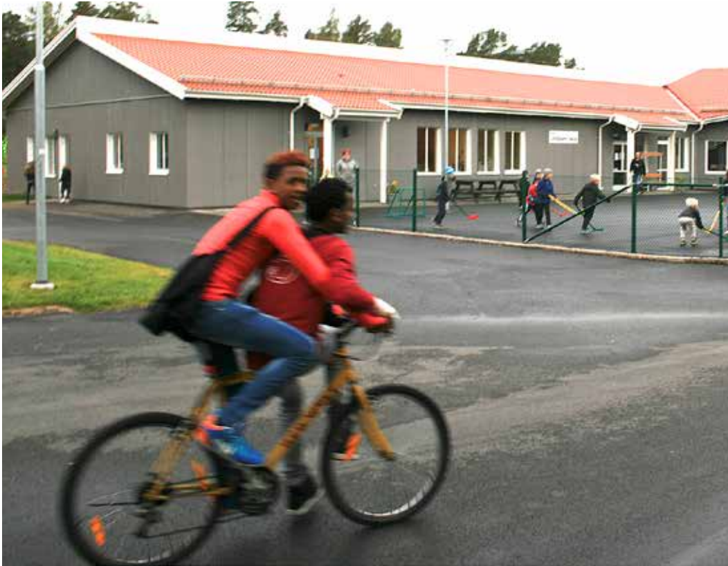
Eleverna på Centralskolan har fått upp ångan och höjer betygen.