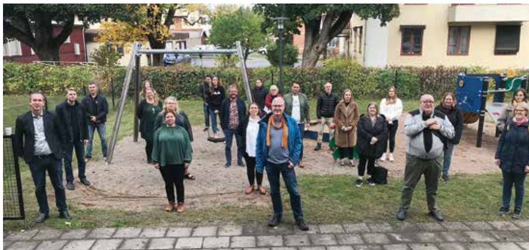
Första personalmötet inför sammanslagningen för drygt ett år sedan.

Det är kartor som tidigare endast var tillgänglig för kommunens personal. Men nu kommer alltså den som vill hitta