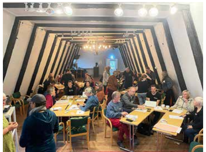
30 turistföretagare slår sina kloka huvuden ihop hur anstormningen till Tivedens nationalpark ska hanteras.