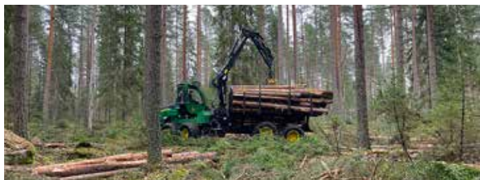
Detta sätt att avverka skogen kräver mindre skotare.

De maskiner som Finnerödja skogstjänst använder sig av är mellanstora skördare och något mindre skotare, röjsåg och motorsåg. Ibland har företaget även anlitat hästen i extra känsliga områden.