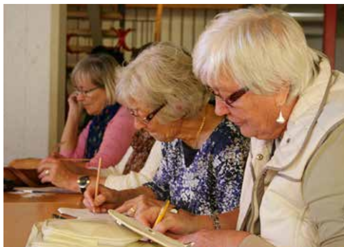
Det blir roligare tillsammans.

Aktiviteterna drar igång i början av 2022 och många av dem är gratis.