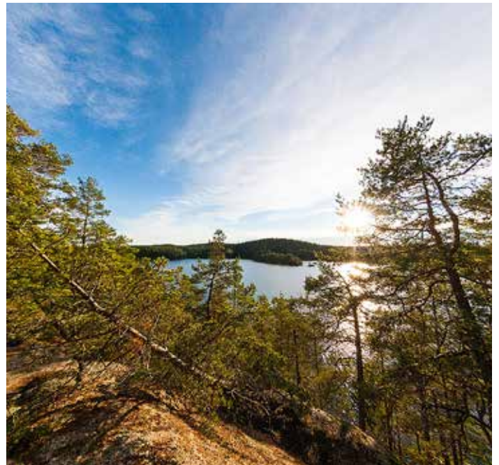
Tiveden är turistnäringens guldägg.