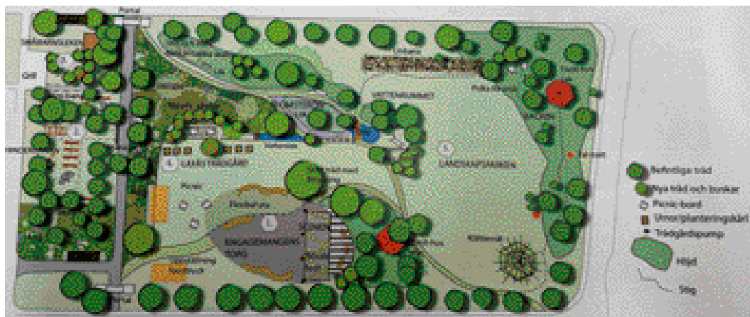
... som blev konkreta förslag.