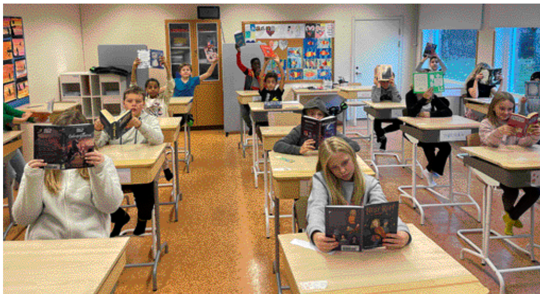
Klass 4 A läser bok på bok för att ta hem segern i stora läsutmaningen.

Harry Potter, Nelly Rapp, Bråfalls hemlighet, Ödesryt-