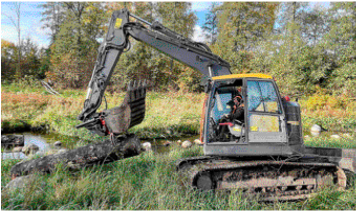
Sören Stenefjord möblerar om i Laxån. Nedfallna träd blir perfekta naturliga hinder för fisken att ta sig över när de vandrar uppför ån.