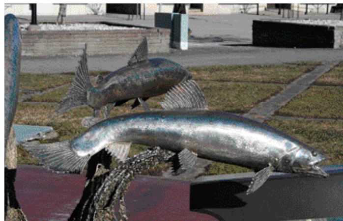
Laxå tätort har sina kvaliteter. Närheten till naturen uppskattas av många liksom lugnet och föreningslivet. På önskelistan står fler aktiviteter för unga. Arkivbilder

Laxåborna har sagt sitt om hur Laxå tätort kan utvecklas och bli mer attraktiv. Drygt hundra svar inkom på enkäten som invånarna fick möjlighet att svara på hösten 2021.