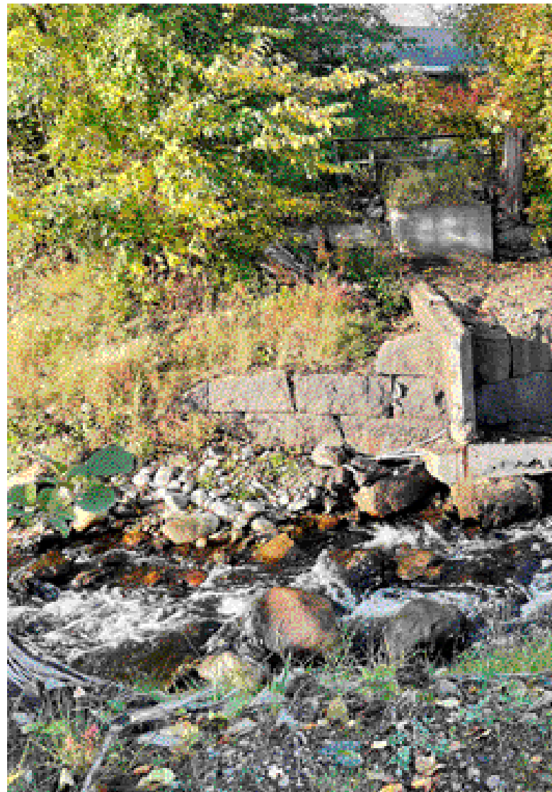
Den gamla sulfid dammen i Laxån revs förra året. Nu kan vattnet forsas förbi

Fotnot: Man skulle kunna tro att Laxån fått sitt namn efter fisken. Men så är det inte. Förleden Lass- som i Lassåna kommer troligen av det dialektala lad, som betyder hög, stapel eller vägbank. Lass- i det här fallet syftar på en vägbank där Eriksgatan passerade och där Laxå bruk anlades 1643.