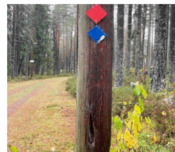
Utdömda elljusstolpar ersätts.

Arbetet innebär inte att några spår behöver stängas av utan det går bra att motionera vidare medan arbetet pågår.