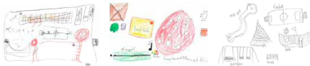
Teckningarna med idéerna ...