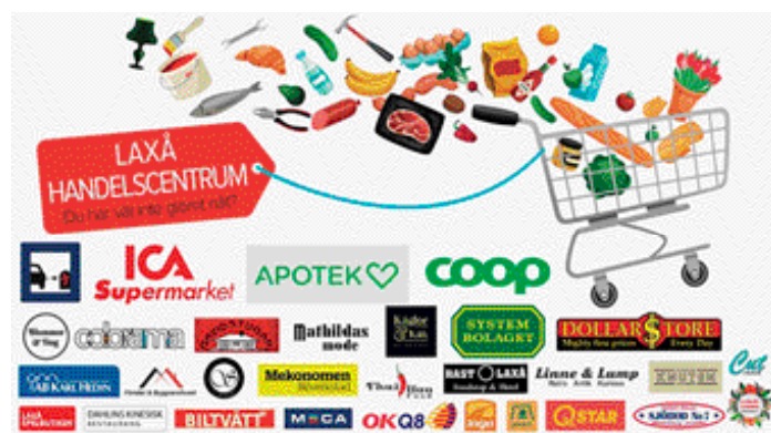
Nu skyltas Laxå handelscentrum upp.

– Vi undersöker också möjligheterna att etablera skyltar på längre avstånd efter E 20 så bilister kan ta in informationen i god tid och fatta beslut