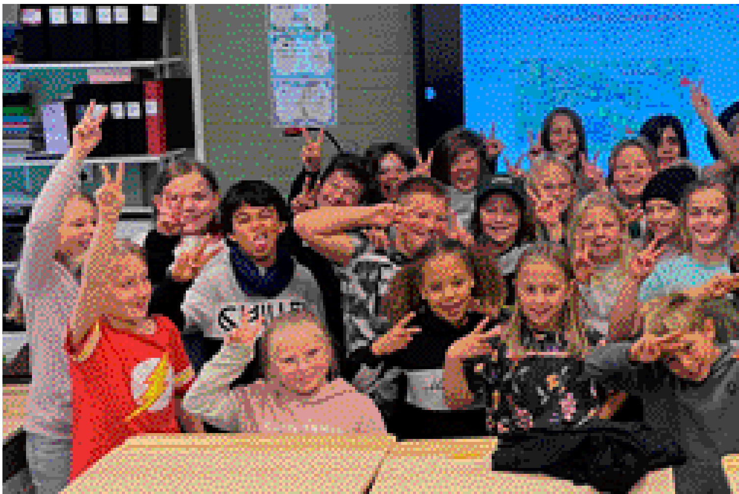
Tacka Saltängsskolans årskurs tre för formgivningen av blivande kulturaktivitetsparken i Bodarneparken.