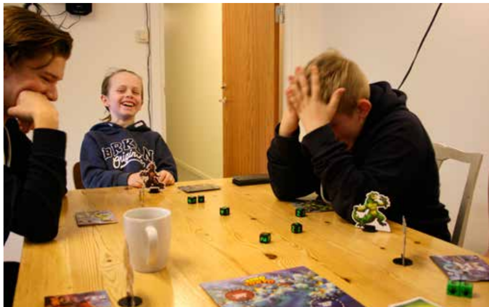
Neeej! Stämningen är hög när brädspelsklubben spelar King of Tokyo.