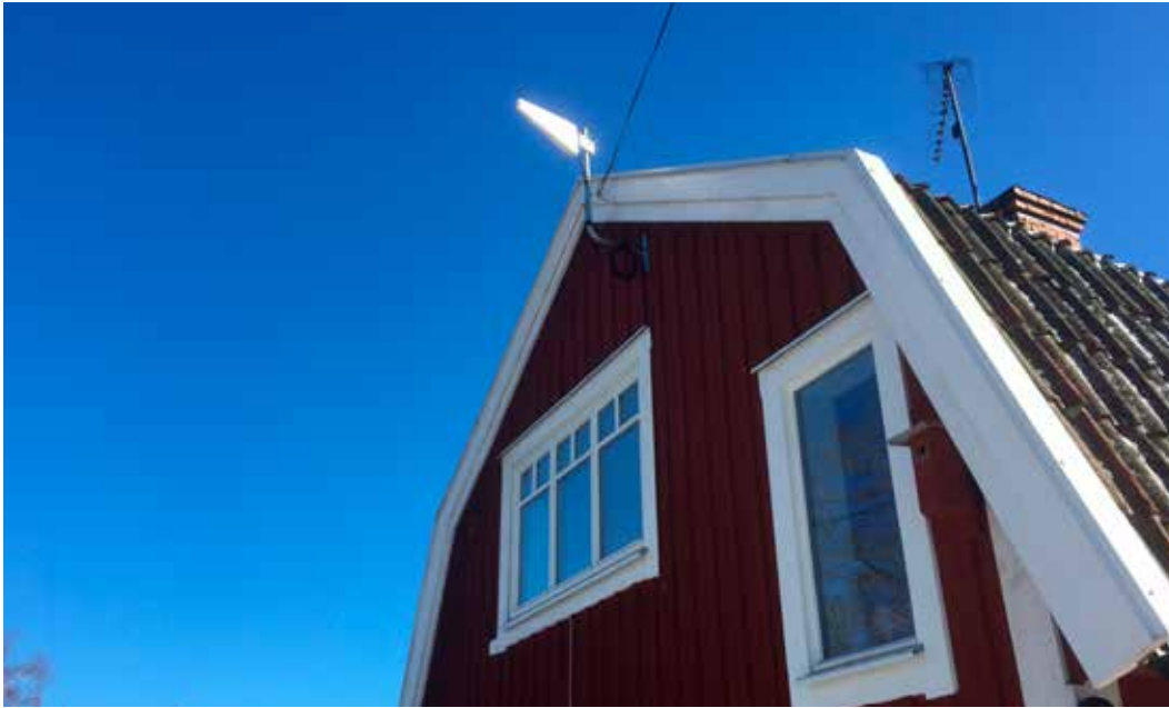
Ibland kan mobilsignalen behöva förstärkas med en antenn.