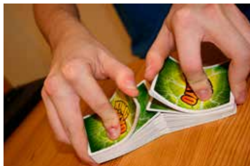
Händerna tillhör Simon Strålin som blandar en kortlek lätt som en plätt!