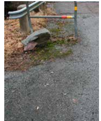
Ska en tobaksfri arbetstid göra att fimparna försvinner från gatan?