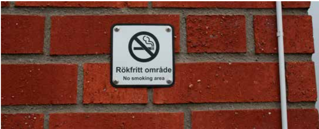
Det råder rökförbud på Centralskolans skolgård precis som på alla landets skolgårdar året runt, dygnet runt.