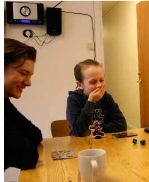
... ska det lyckas? Ett, två, tre försök!