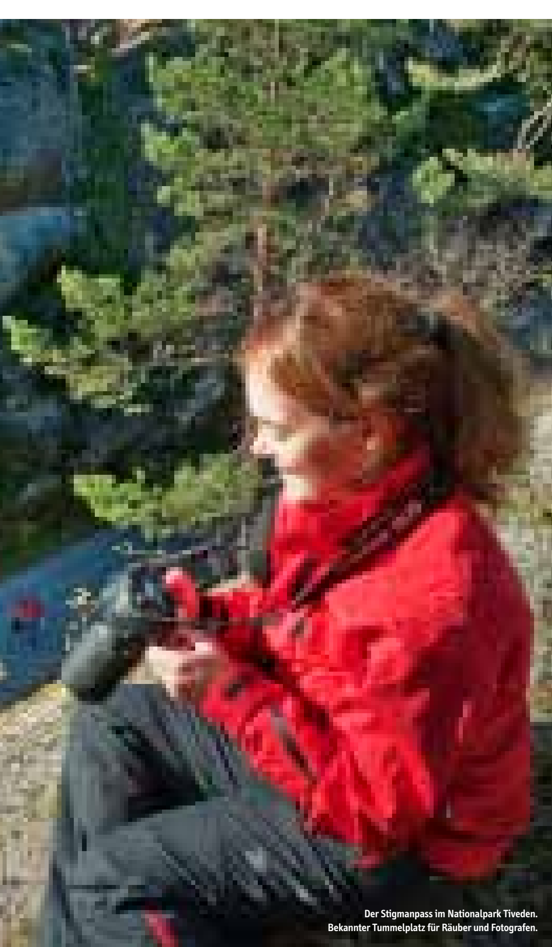
Der Stigmanpass im Nationalpark Tiveden. Bekanntes Tummelplatz für Räuber und Fotografen.