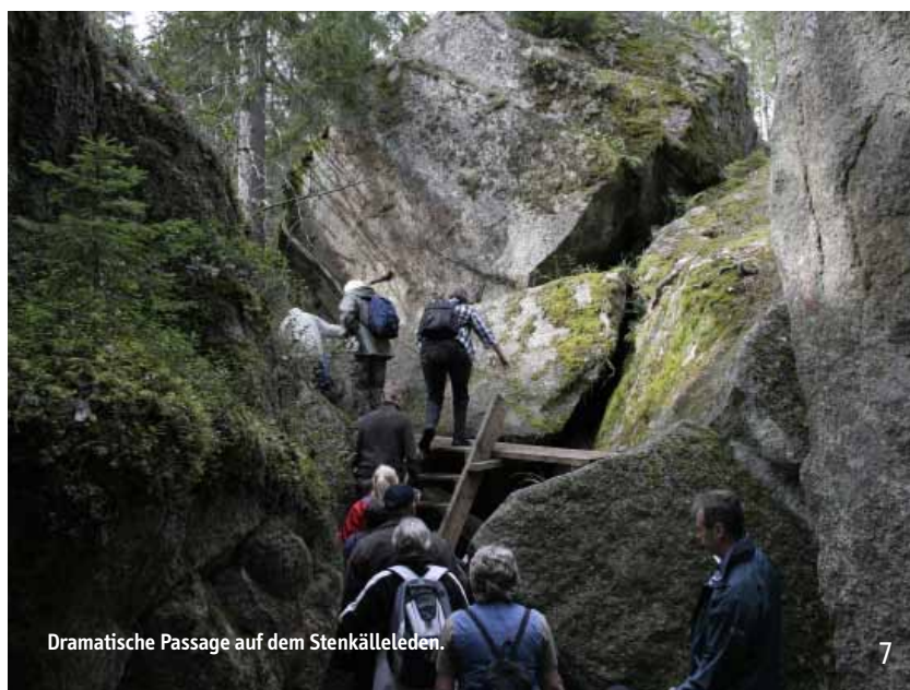
Dramatische Passage auf dem Stenkälleleden.

Erkunden Sie Tiveden mit dem Fahrrad. Hier gibt es jede Menge gut befahrbarer Schotterwege, die sich durch die Landschaft schlängeln, und auch das Flaggschiff der Radwanderwege – der Sverigeleden – führt durch Tiveden.