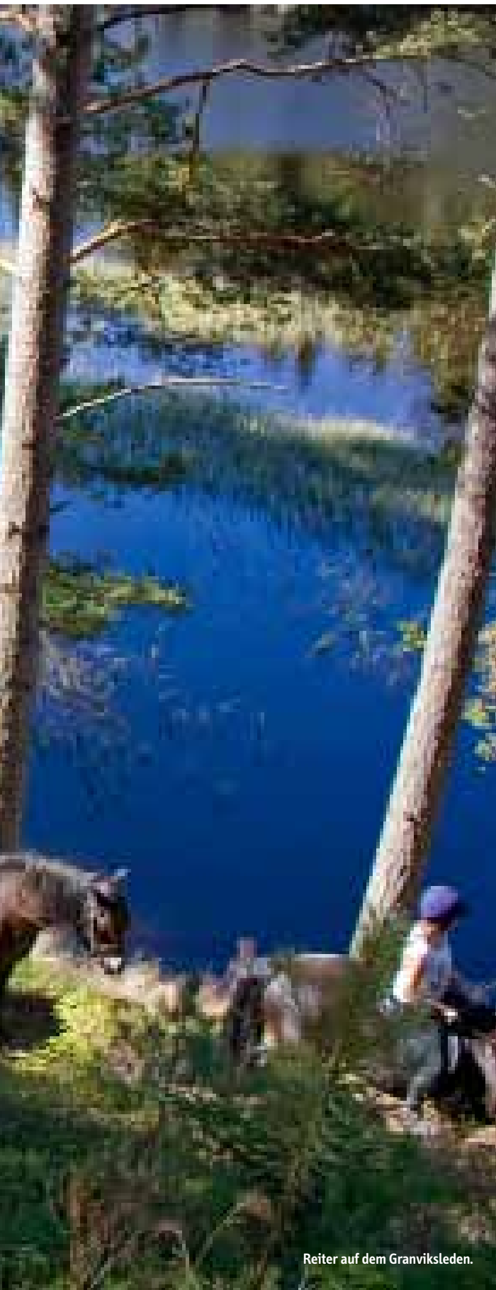
Reiter auf dem Granviksleden.