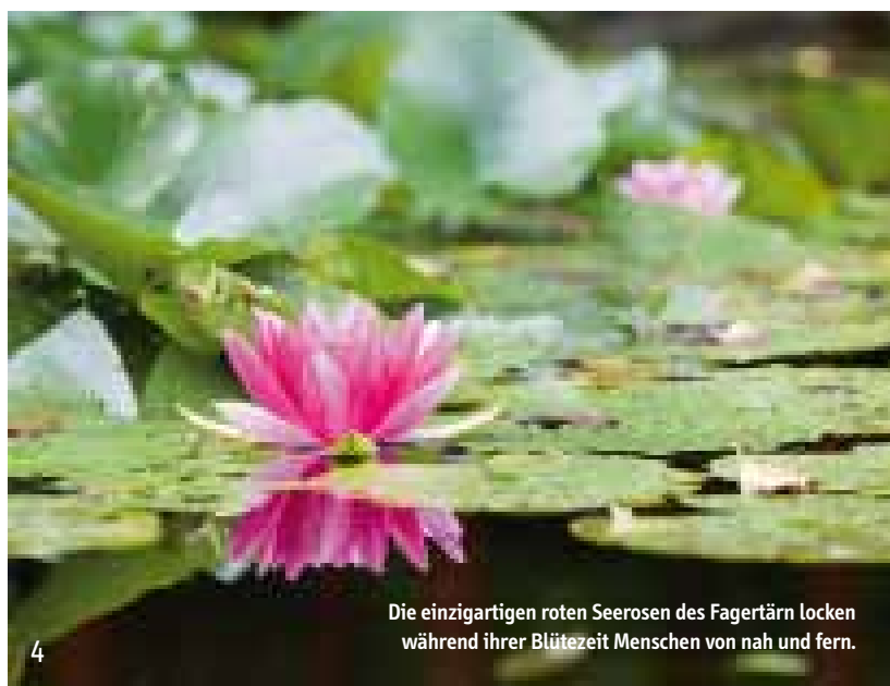
Die einzigartigen roten Seerosen des Fagertärn locken während ihrer Blütezeit Menschen von nah und fern.

Doch Tiveden hat noch viel mehr zu bieten. Eine Reihe von Naturschutzgebieten, über das gesamte Waldreich verteilt (siehe Besucherkarte), sorgen für unvergessliche Naturerlebnisse.