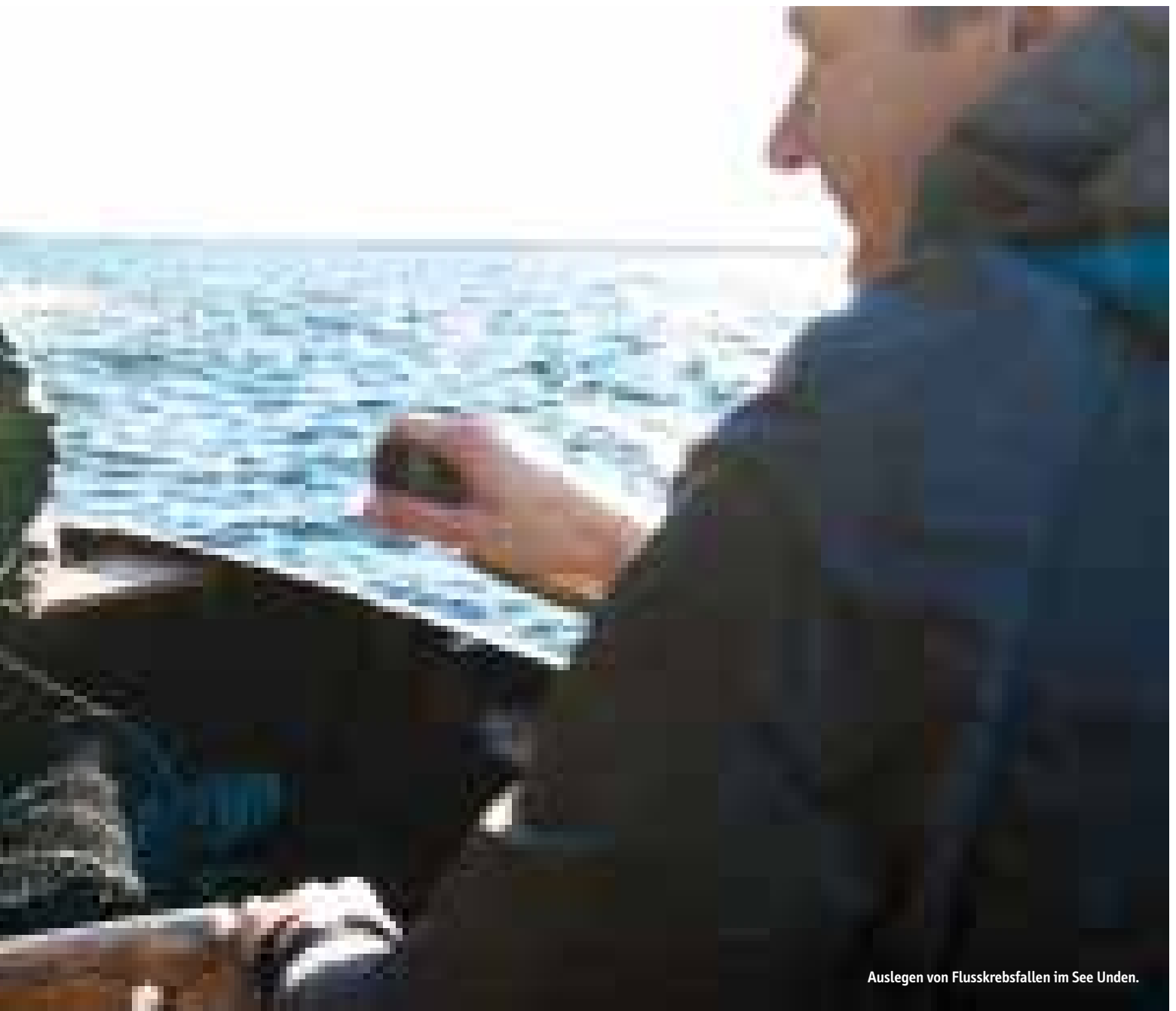
Auslegen von Flusskrebbsfallen im See Unden.