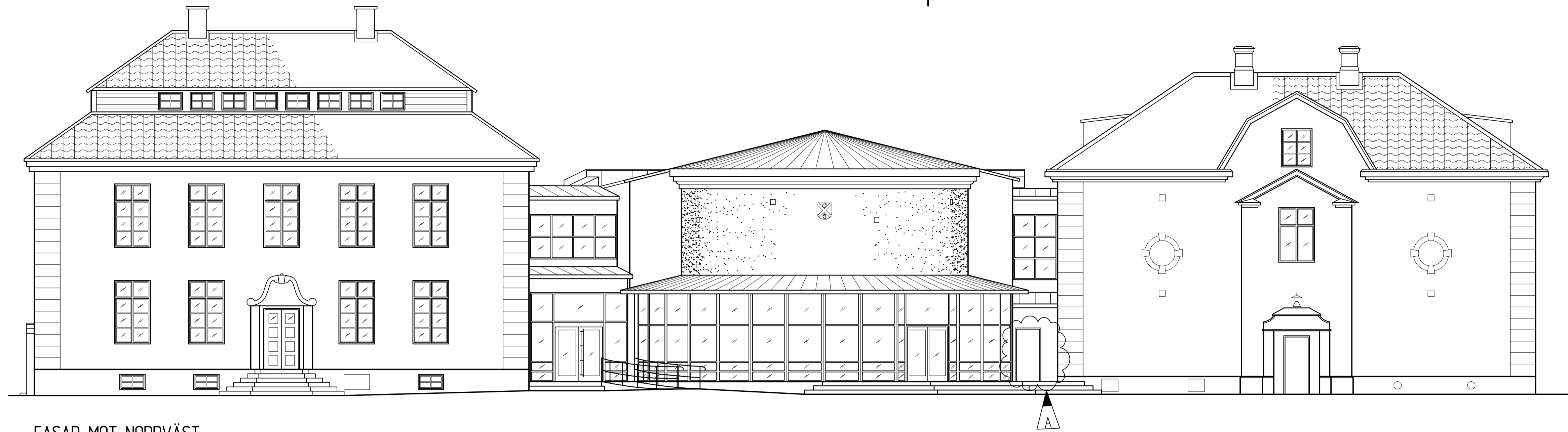
FASAD MOT NORDVÄST HUS A