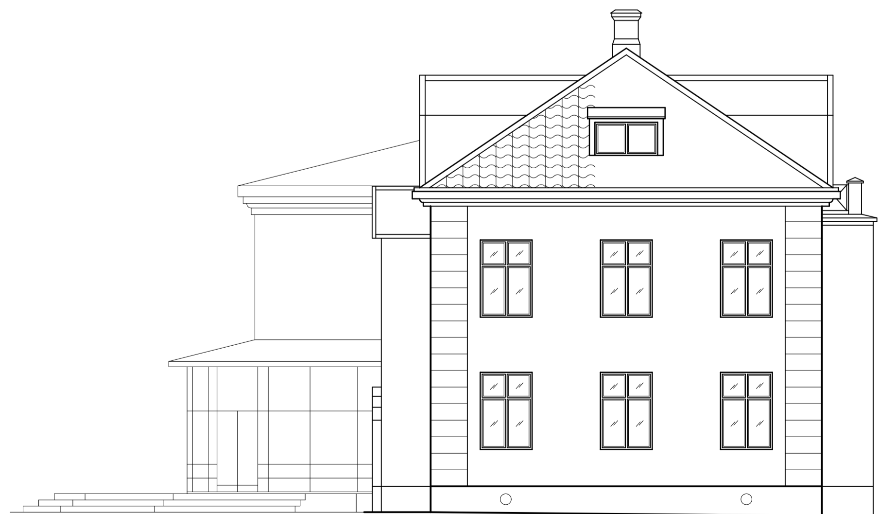
FASAD MOT SYDVÄST HUS C

RITNINGEN KAN EJ BETRAKTAS SOM UPPMÄTNINGSRITNING EFTERSOM EN FULLSTÄNDIG UPPMÄTNING EJ HAR UTFÖRTS PÅ BEFINTLIGA BYGGNADSEDELAR.