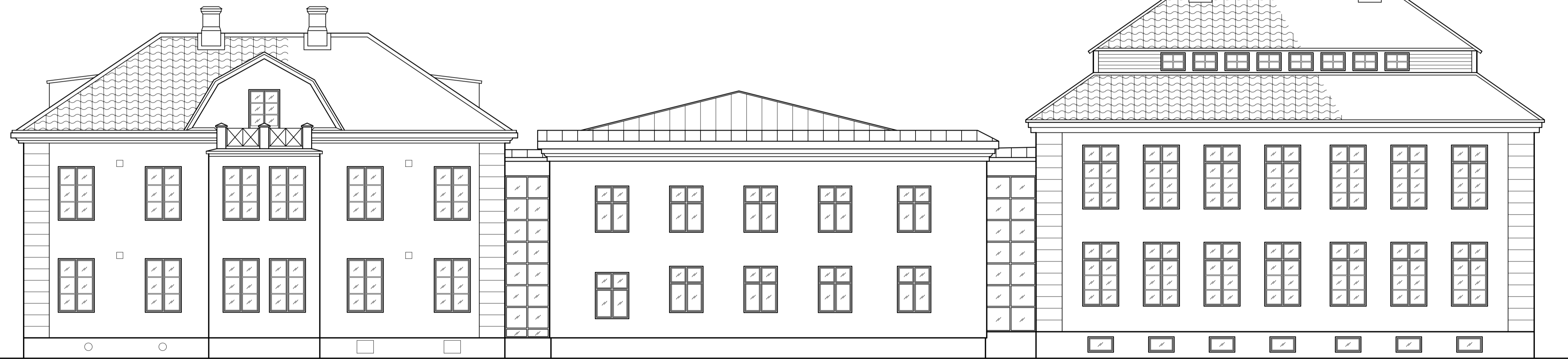
FASAD MOT SYDÖST HUS C