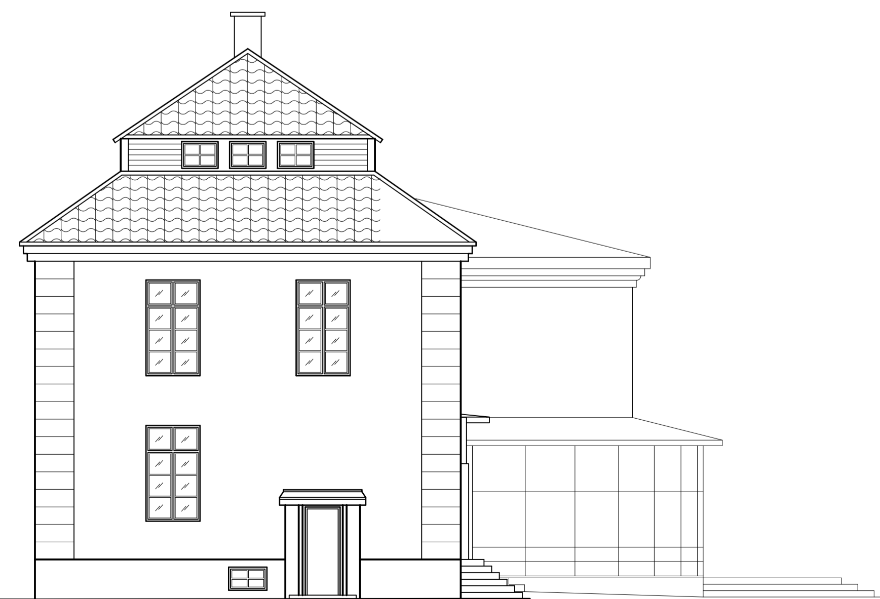
FASAD MOT NORDÖST HUS A