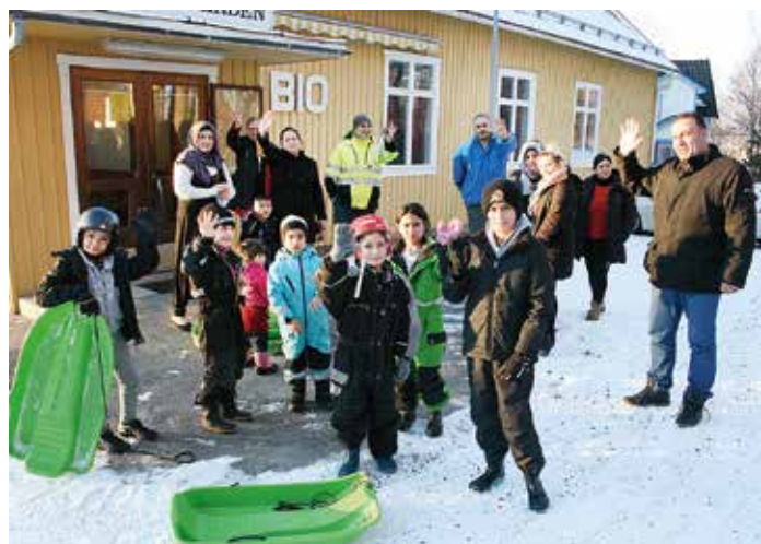
Pulkorna fick vänta utanför när barnen med föräldrar från kommunens evakueringsboende gick in på Hasselgården för att titta på bio. På repertoaren stod "Flykten från hönsgården".

Hasselfors byalag fick förra året ett bidrag på 16 000 kronor ur föreningsfonden för integrationsverksamhet för sina insatser.