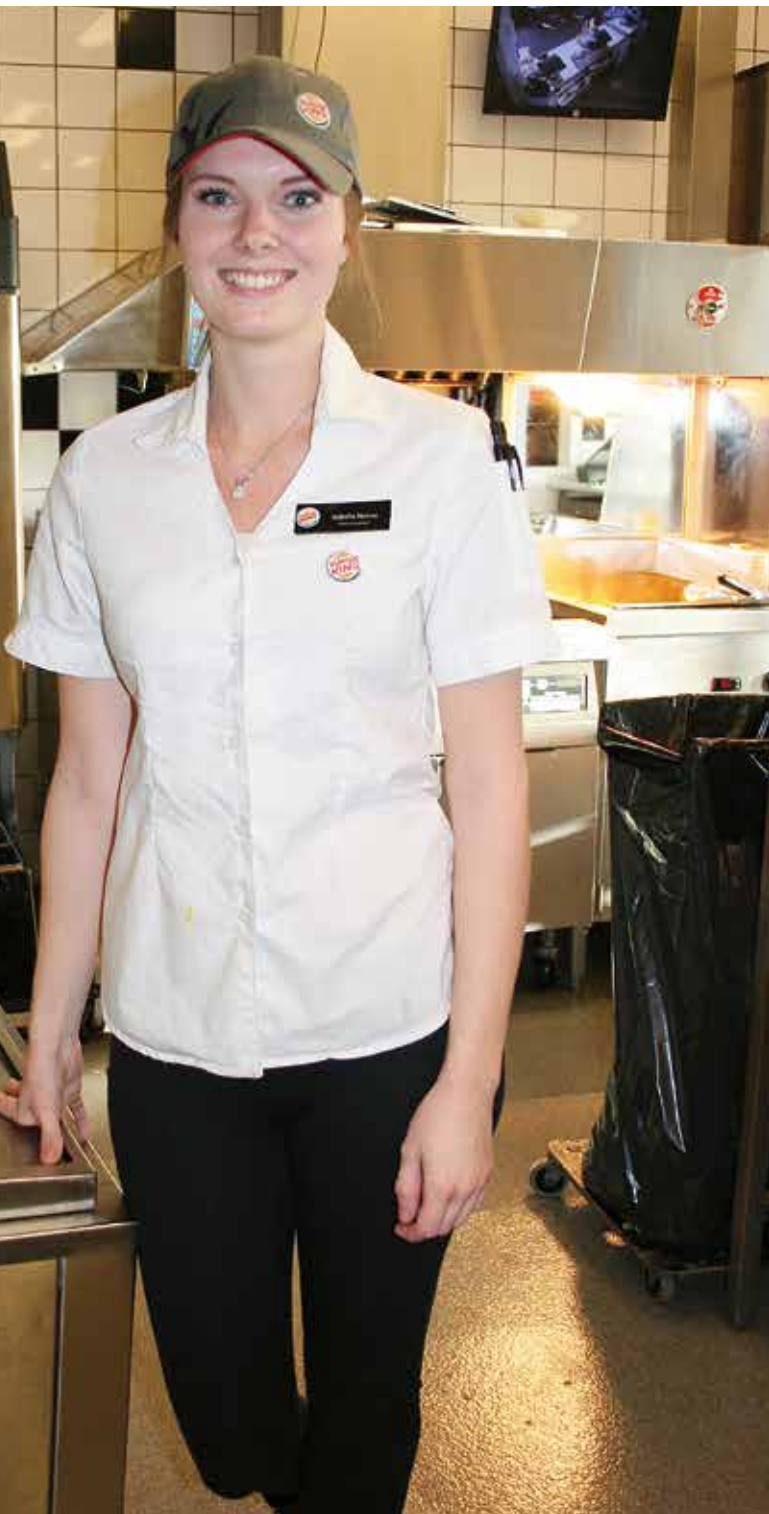
från sommarjobbare till restaurangchef. Nu basar hon för Burger King i Laxå.