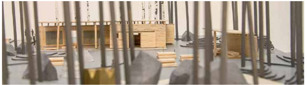
Modellen visar hur huvudentréns informationsbyggnad ska se ut. Arkitektbyrån White har gjort förslaget som byggs av Bygghyttan i Karlsborg AB.