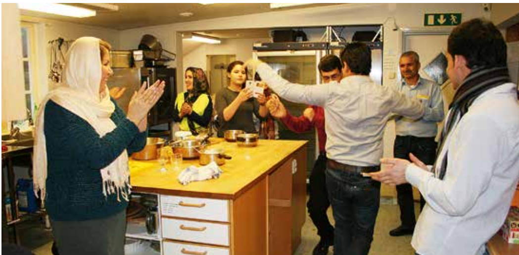
Maten är klar och tid för en dans i Tivedstorps kök till afghanska popsångerskan Aryana Sayids sång från Youtube.